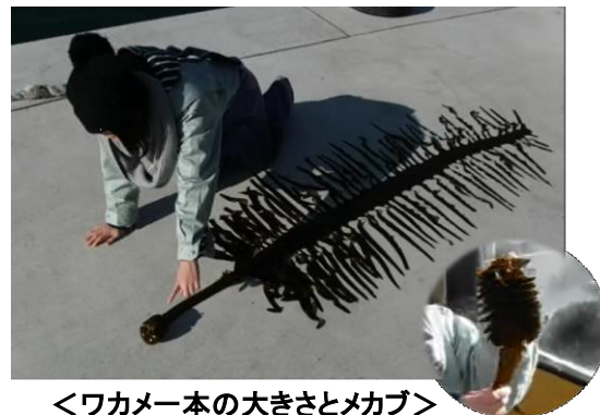
＜ワカメ一本の大きさとメカブ＞

湯通しして刻んだメカブをそのまま食べたり、ご飯に乗せて食べても美味しいですが、納豆やとろろなどのネバネバ食材と混ぜても美味しくいただけます。今が旬のメカブを、是非ご賞味ください！