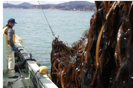
＜水揚げされるワカメ＞

宮城県のワカメ(メカブ)の水揚げ量は、岩手県に次いで全国第2位(平成27年統計)です。宮城県では、昭和31年に種苗の量産化に成功したと同時に女川町小乗浜で垂下式による養殖が始まりました。現在では、牡鹿半島より北の沿岸部では主要な養殖種となっており、全国に美味しいワカメとメカブを送り届けています。